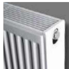
TYPE 22 (TYPE 33)