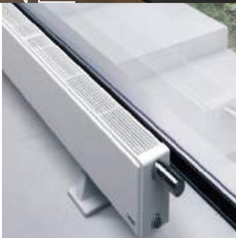
Flat-Plint-Line White Fine Texture

PL Autentyczność to standard, także w zakresiewzornictwa grzejników dekoracyjnych. Grzejnik musi być produktem z charakterem: funkcjonalnym i ponadczasowym, stylowym i pięknym oraz przyjemnym w dotyku. Grzejnik Vasco ucieleśnia te cechy. Produkt ten pozbawiony został wszelkich zbędnych elementów, w swoim naturalnym wzornictwie łączy prostotę, wydajność i funkcjonalność. I, co bardzo ważne, rezultat końcowy pracy projektantów musi zachować swoją autentyczność, funkcjonalność i moc inspirowania nie tylko dzisiaj, ale również przez kolejne trzydzieści lat.