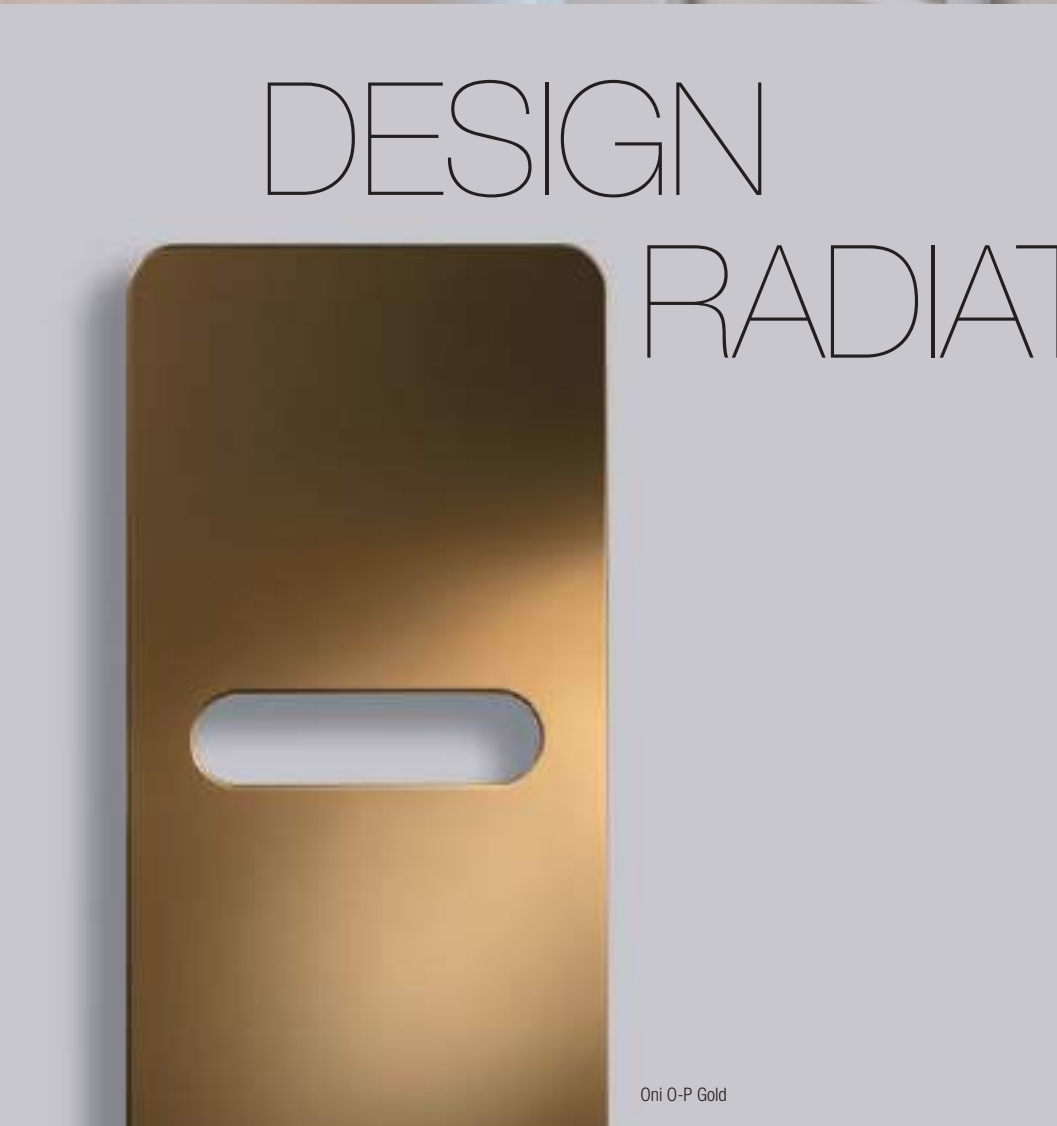
Oni O-P Gold