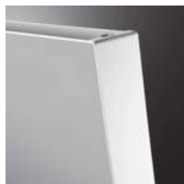
TYPE 22 (TYPE 21S) Modele dostępne w Polsce