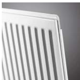
TYPE 10 (TYPE 20S) Not available in Germany Kolekcja nie dostępna w Polsce