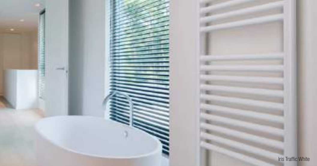
Iris Traffic White