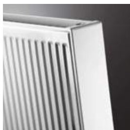
TYPE 22 (TYPE 21S) Modele dostępne w Polsce