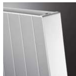
TYPE 22 (TYPE 21S)