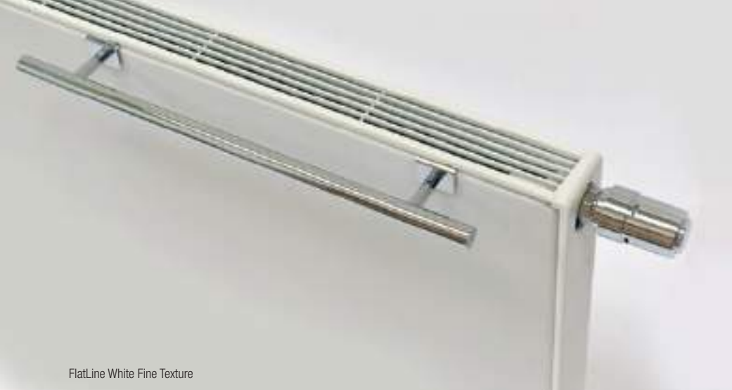
FlatLine White Fine Texture