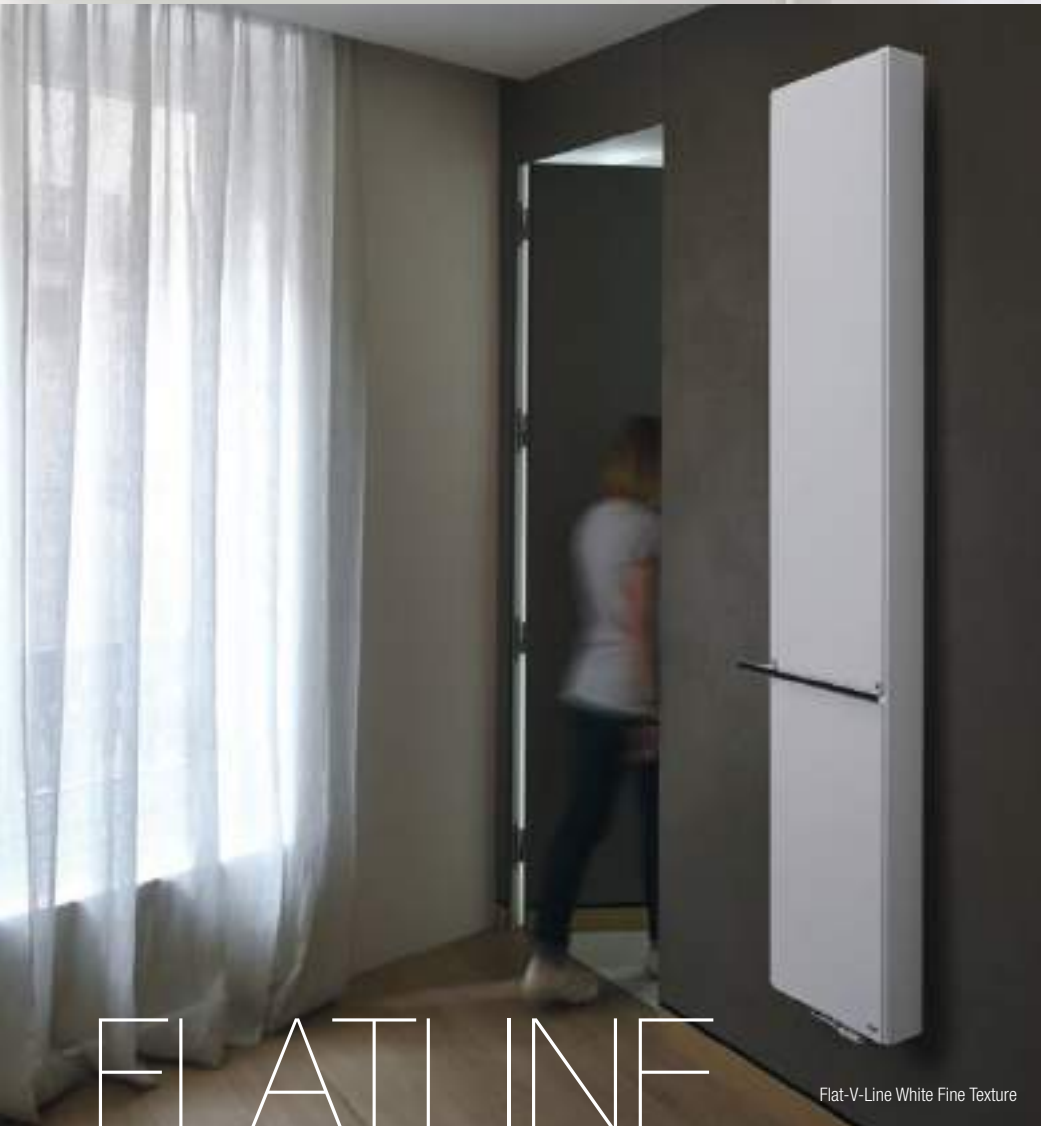
Flat-V-Line White Fine Texture