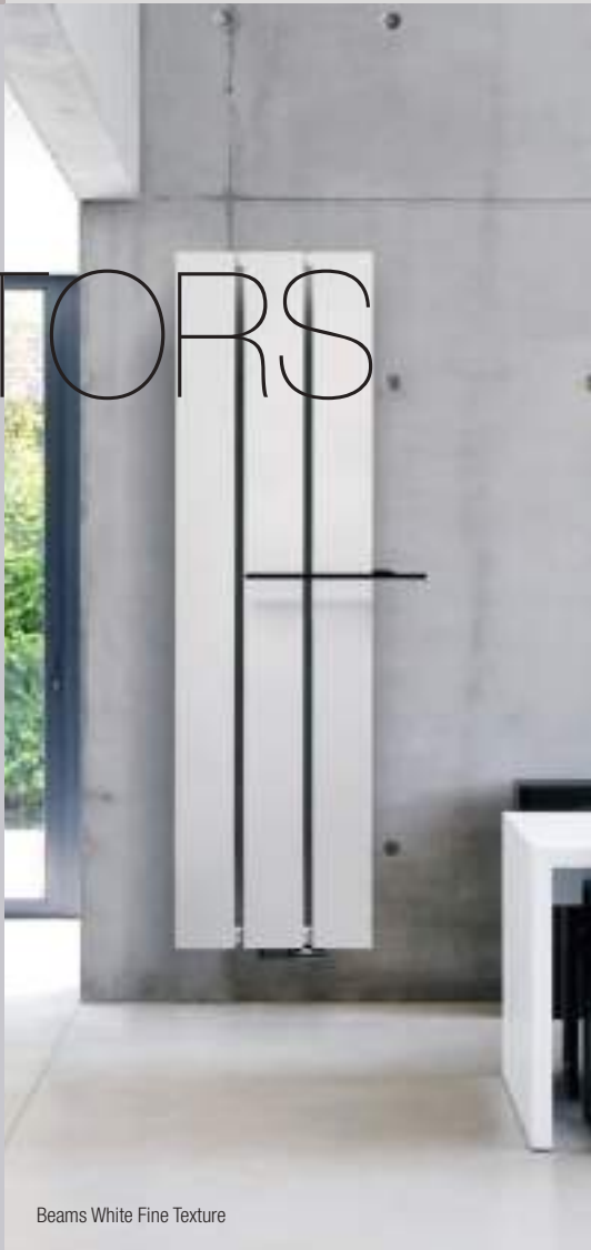
Beams White Fine Texture