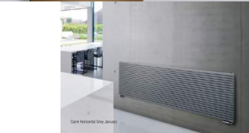
Carré Horizontal Grey January